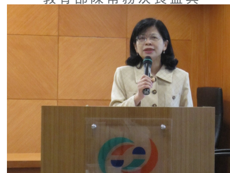
行政院金融監督管理委員會楊委員雅惠